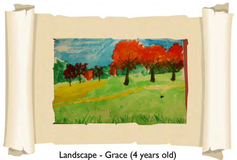
Landscape - Grace (4 years old)